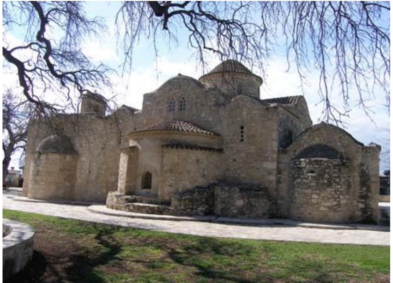
Церковь в честь Панагии Ангелоктисти, Всесвятой Богородицы Ангелозданной

Храм построен в 11 веке на руинах христианской базилики, датируемой 5 веком. По преданию жители собрались в деревне, чтобы укрыться от набегов арабов. После начала строительства жители обнаружили, что основание церкви переместилось, а ночью они увидели ангелов, строящих церковь.