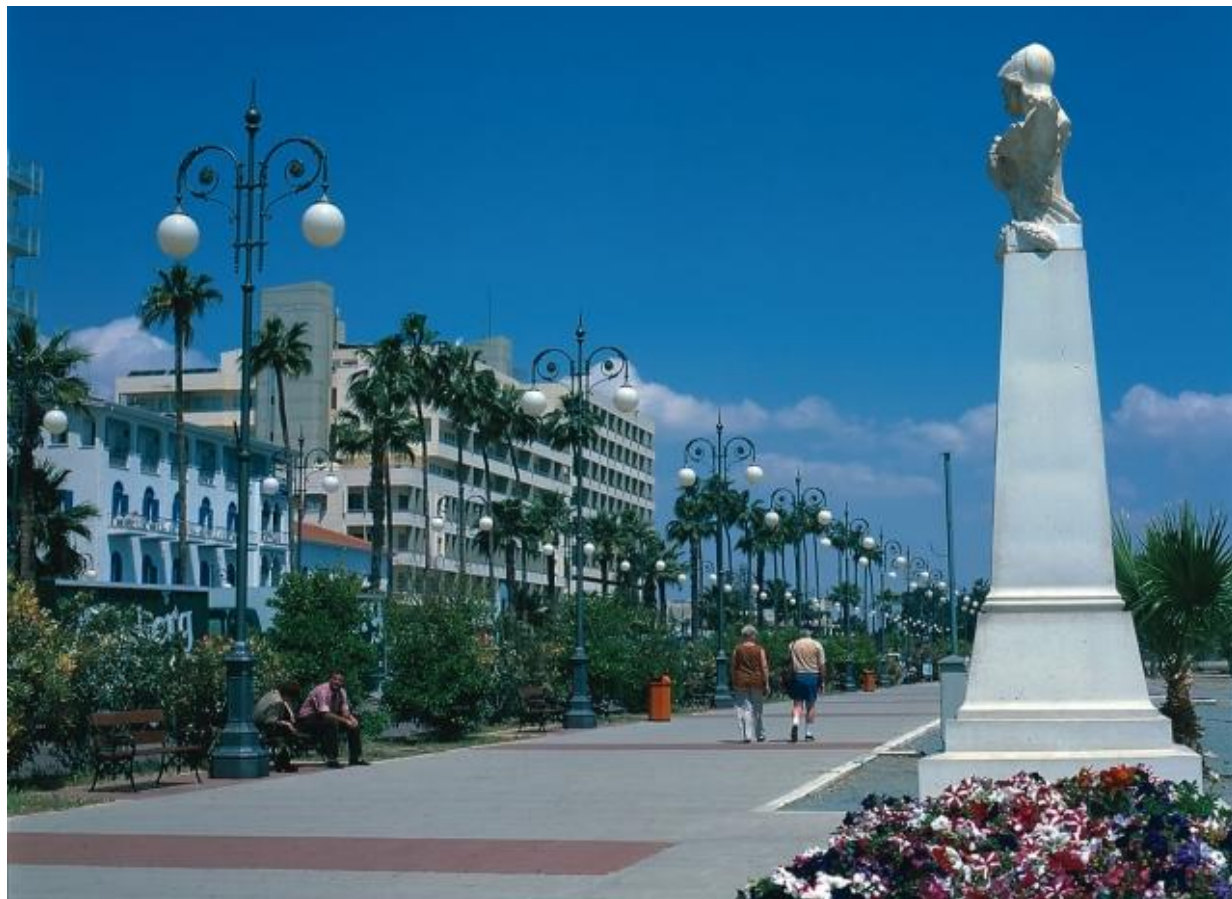
Афинский генерал Кимон